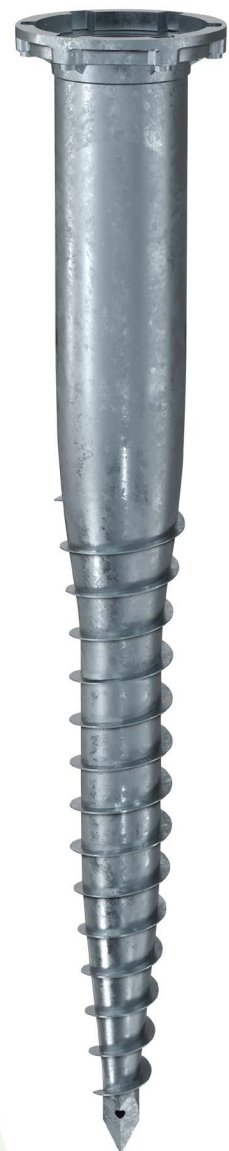
KSF E 140x1300-E76-100